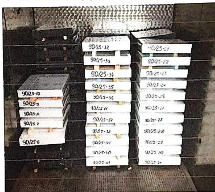
Рисунок 2 – Загальний вигляд дослідних зразків плит теплоізоляційних зі спіненого полістиролу марки «EPS-90» виробництва ТОВ "ТЕРМОПАНЕЛІ", розміщених в кліматичній камері

Показник ресурсу, що визначається за формулою (1), становить r = 0,0004 .