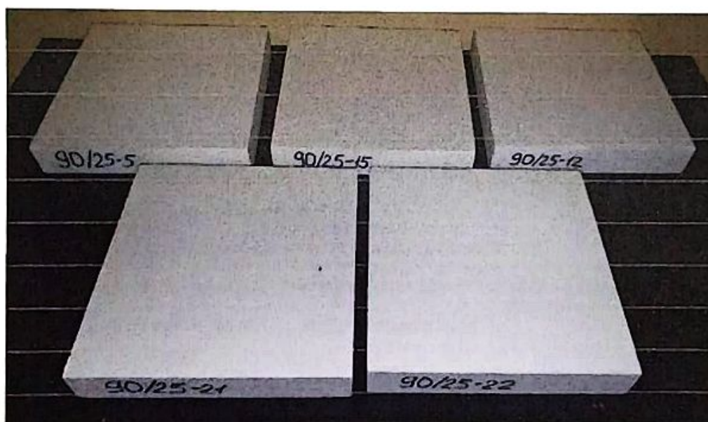
Рисунок 1 – Загальний вигляд досліджуваних зразків № 90/25

де t_n – температура повітря в приміщенні, \varphi – вологість повітря в приміщенні.