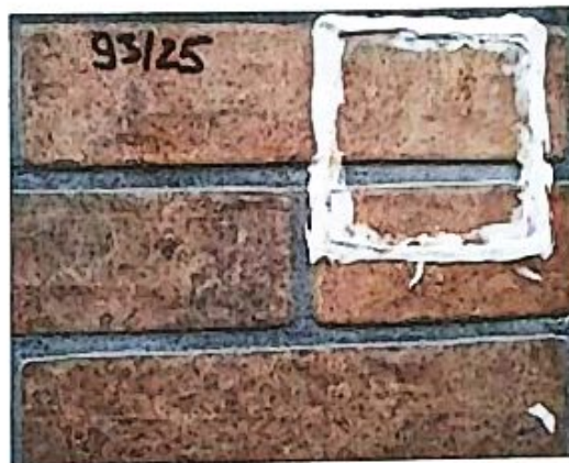
Рисунок 3 – Зовнішній вигляд досліджуваного фрагменту

11.3. Згідно п. 6.3 ДСТУ Б В.2.6-36:2008 стійкість системи до кліматичних факторів повинна складати не менше 50 циклів для зовнішніх стін, при цьому зниження теплового опору конструкції повинно бути не більше 10 %.